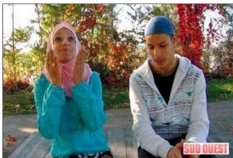
« La Perle rare », l'un des cinq sketches présentés sur le site. Un nouveau sera mis en ligne tous les quinze jours

Qui a dit que les musulmans n'avaient pas d'humour ? » Le slogan annonce la couleur, le premier film aussi. Dans « La Perle rare », une jeune fille essaie de mettre un foulard islamique avant son rendez-vous galant, histoire d'être « comme il faut ». Après l'entrevue polie, la caméra reste sur le garçon qui enlève son taguia, remet sa casquette et appelle son pote : « ça a marché, cousin ! »